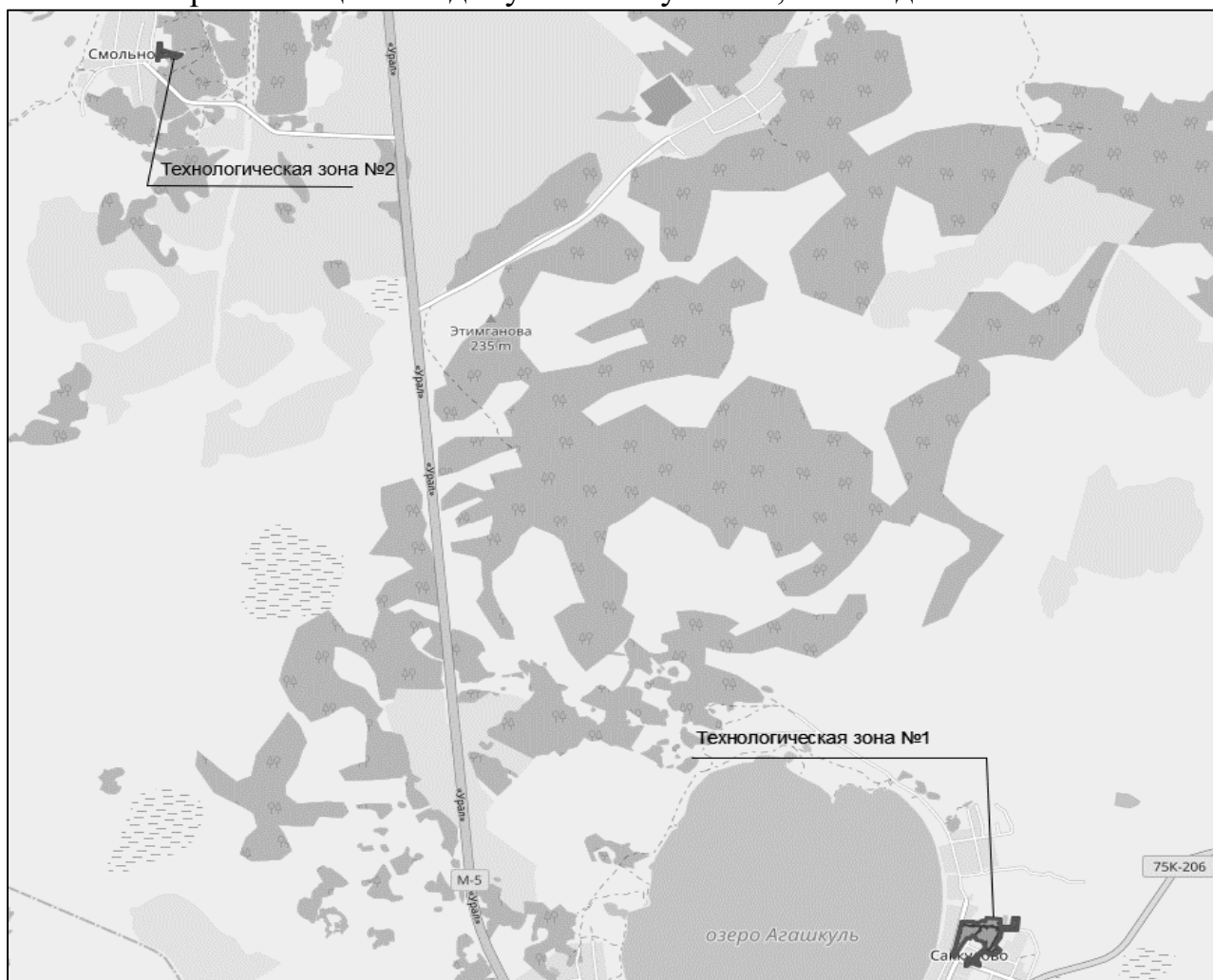
Рисунок 2.1.1. Зоны действия систем централизованного теплоснабжения

2.3. Существующие и перспективные балансы тепловой мощности и тепловой нагрузки потребителей в зонах действия источников тепловой энергии, в том числе работающих на единую тепловую сеть, на каждом этапе