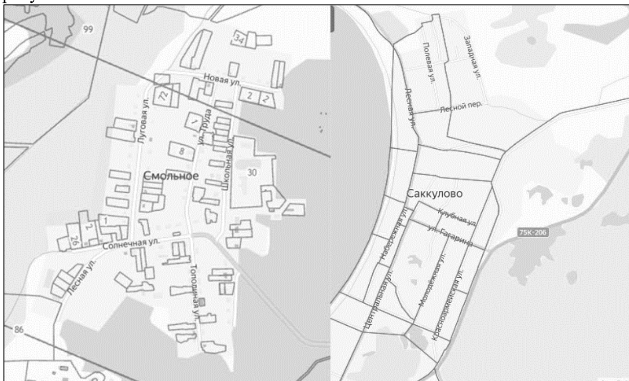
Рисунок 1.1.3. Кадастровое деление Саккуловского сельского поселения

Кадастровый номер 74:19:010* 1 (74 – Челябинская область, 19 – Сосновский район, 010* - Саккуловское сельское поселение), изображено на рисунке 1.1.3.