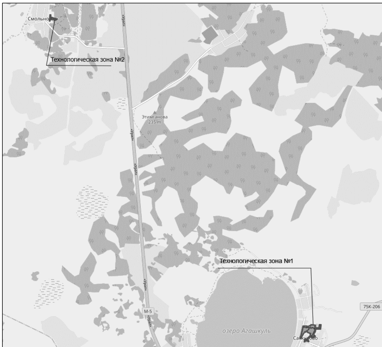
Таблица 1.1.1.1. Деление функциональных структур теплоснабжения Ценовые зоны теплоснабжения не установлены на территории сельского поселения.

В качестве сетки расчетных элементов территориального деления, используемых в качестве территориальной единицы представления информации, принята сетка кадастрового деления территории Саккуловского сельского поселения.